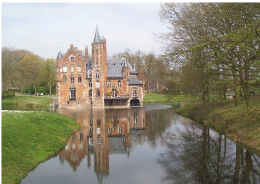
Kasteel Wissekerke te Bazel